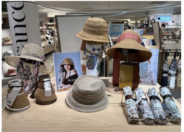
婦人雑貨 帽子など