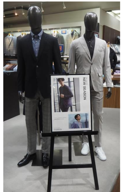
[ダーバン] サマーウール素材ジャケット