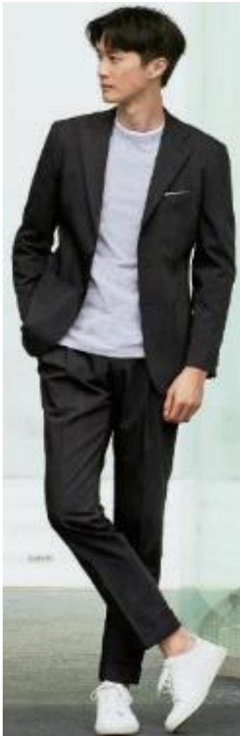
「ウォッシュャブルスーツ」 家で洗えるオーダースーツ