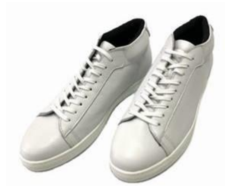
アリスト「レザーシューナー」