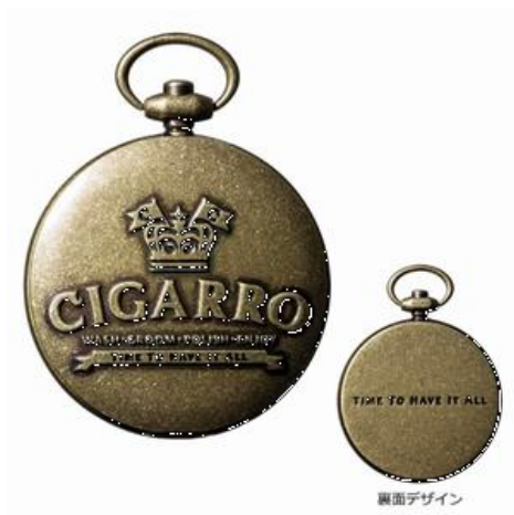
シガーロ「ソリッドパフューム」