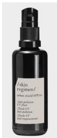
スキンレギメン 「アーバンシールド FPS30」