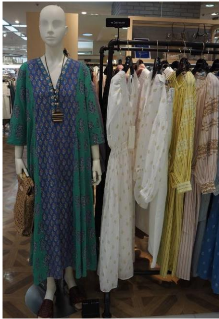
[ハーモニー売場] インド綿素材ワンピース