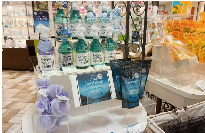
リビング売場: 衣類用冷感アロマスプレー