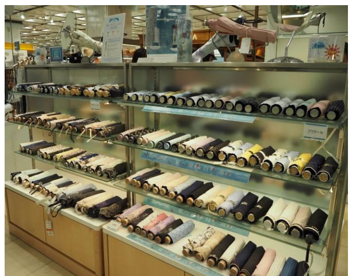
[婦人洋品売場] 晴雨兼用傘