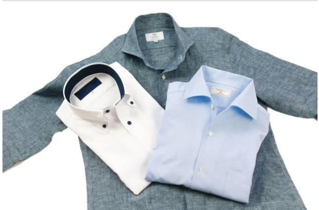
1枚でもきちんと見える、デザインや素材にこだわったシャツ