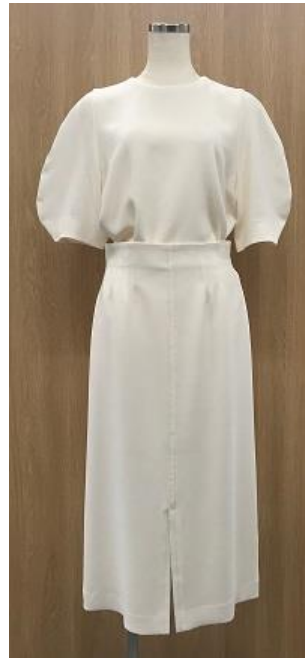
家で洗えるセットアップ