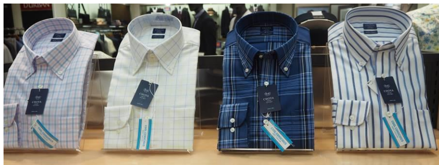
[ワイシャツ売場] クール素材カジュアルワイシャツ