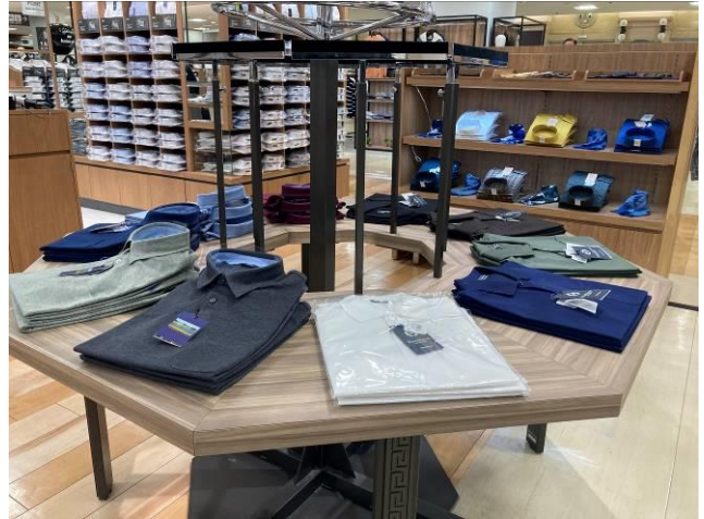
松坂屋上野店 紳士雑貨売場 ビズポロ展開