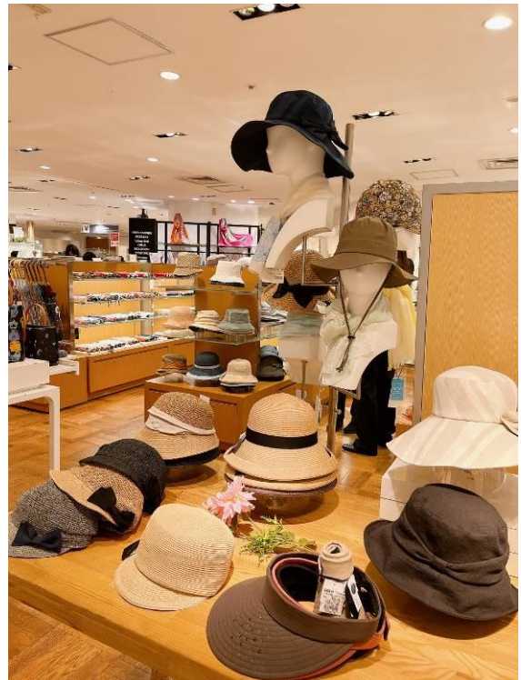
婦人服飾雑貨売場: 帽子