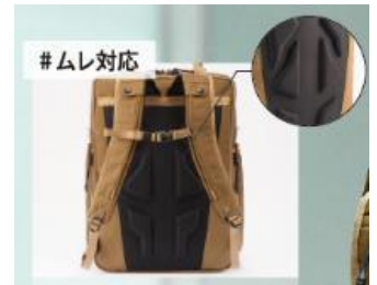
夏の猛暑でも蒸れにくいビジネスシューズとリュック鞆