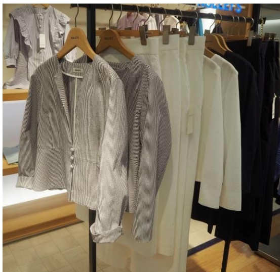
[ノーリーズ] サッカー生地ジャケット・パンツ