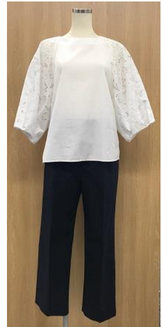
家で洗えるデザインシャツ&パンツ