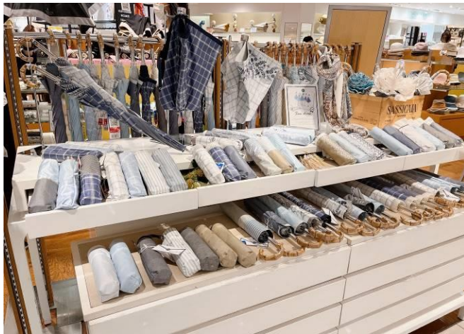
婦人服飾雑貨売場: 晴雨兼用傘