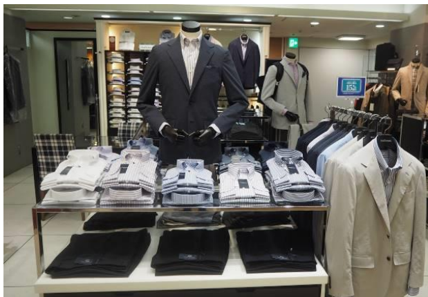
[ニューヨーカー] おうちで洗えるジャケット