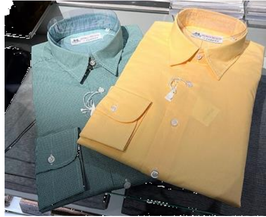
フェアファックス「ショートカラーシャツ」