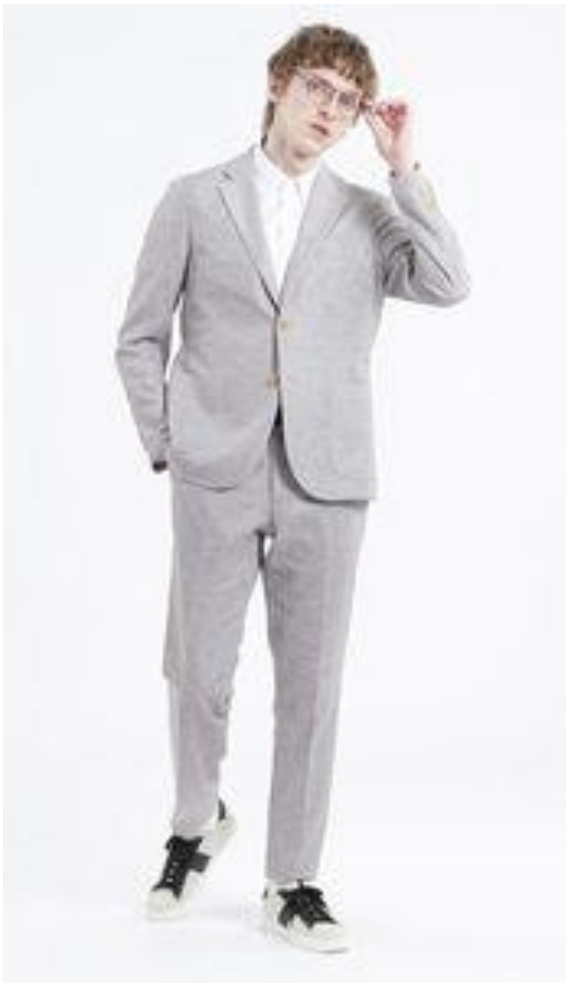
マッキントッシュ フィロソフィー 「カラミ織りセットアップ」

そごう・西武は今年の夏、増える対面の機会を意識して「見栄え」にこだわったビジネススタイルを提案します。