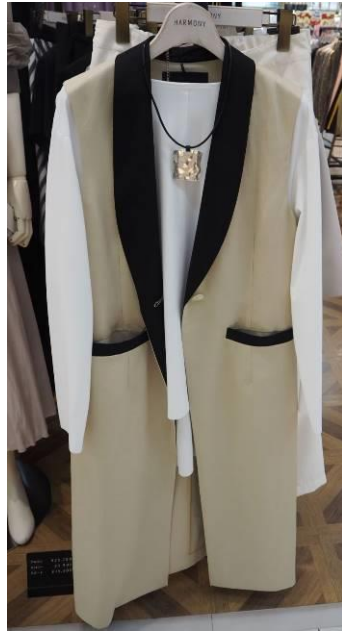
[ハーモニー売場] 接触冷感カットソー