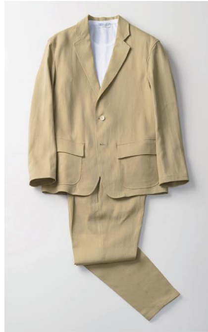
：“軽量・清涼・消臭機能が魅力の” 和紙素材アイテム