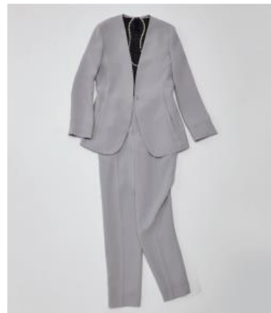
：“どんなに暑くても、スーツで仕事をしなければならない方へ”：機能満載の着まわしスーツ