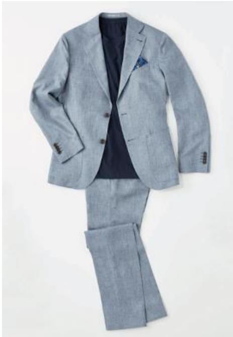
：“衛生的で快適な着心地の” ウォッシュャブルスーツ