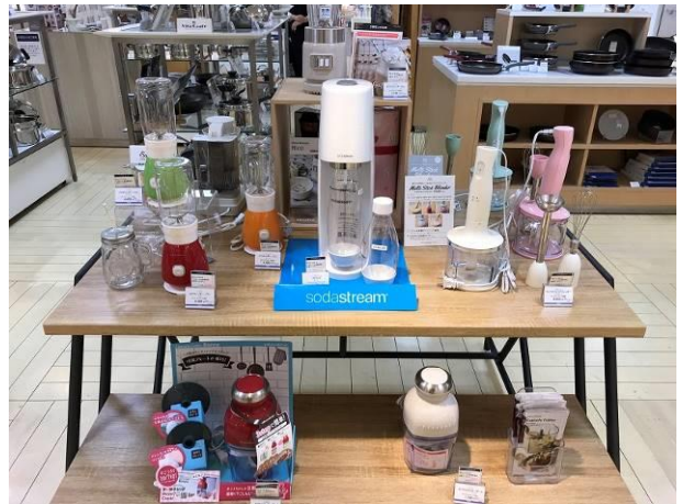
リビング売場：ソーダストリーム