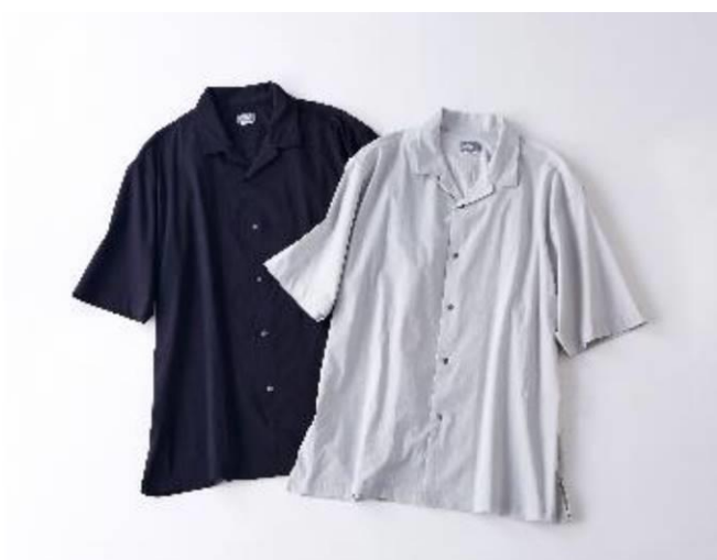
◆オンライン会議上でもアクセント「開襟シャツ」