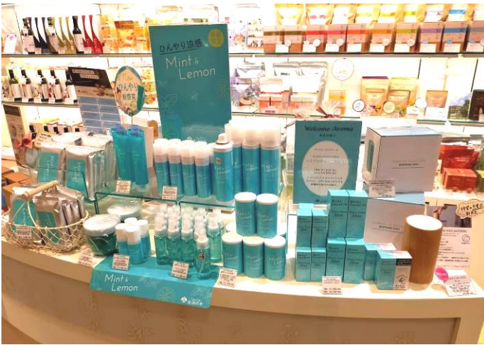
ミントと柑橘のミストローションやボディスプレー