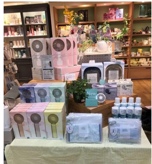
リビング売場：ハンディーファン