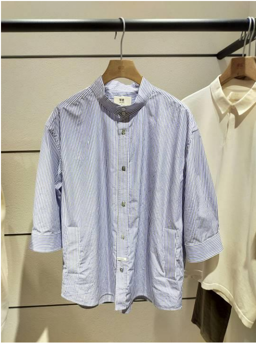
シャツインすることでビジネスにもピッタリな メンズシャツ