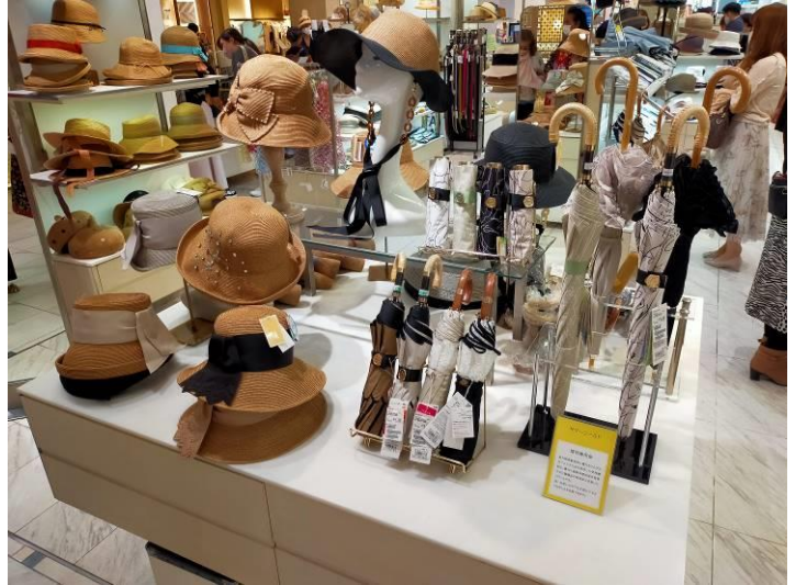
優れた遮熱体感効果のある晴雨兼用傘