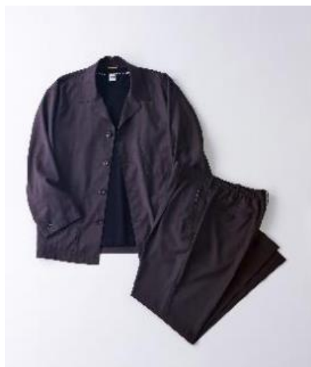
◆オンライン会議でも活躍する「シャツブルゾン セットアップ」