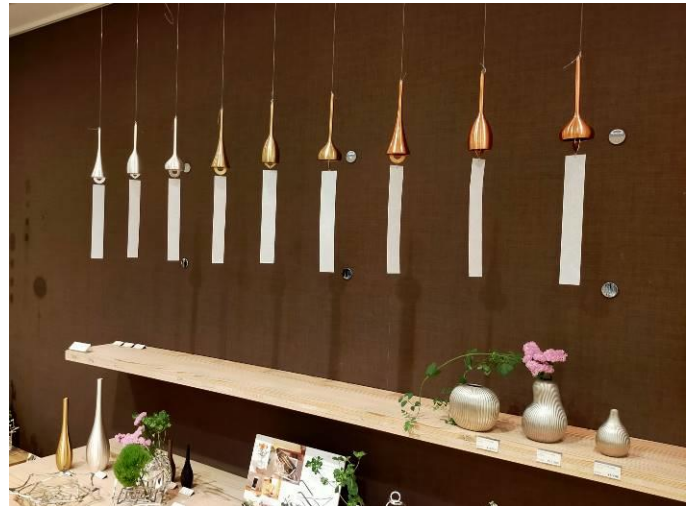
涼を呼ぶ風鈴 (由来は魔除け・疫病除け、今年特に人気)