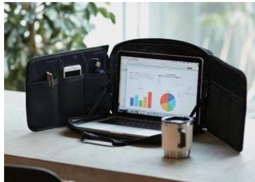
：“多様なワークスタイルを叶える” 進化系ビジネス雑貨