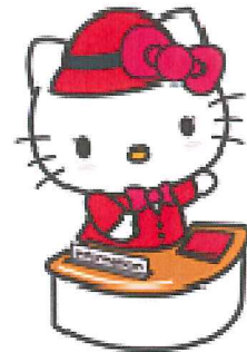
ご案内係ハローキティ