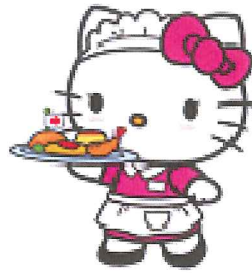
ウェイトレスハローキティ