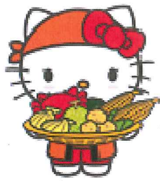
物産展ハローキティ