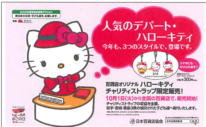
『キティストラップ限定販売ポスター（B3 版横型）』