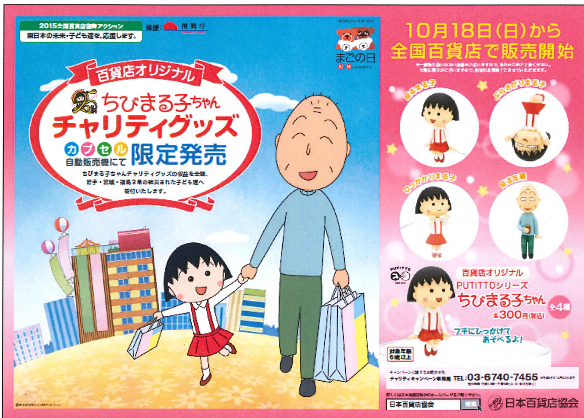
『ちびまる子ちゃんチャリティグッズ限定販売ポスター（B3 版横型）』